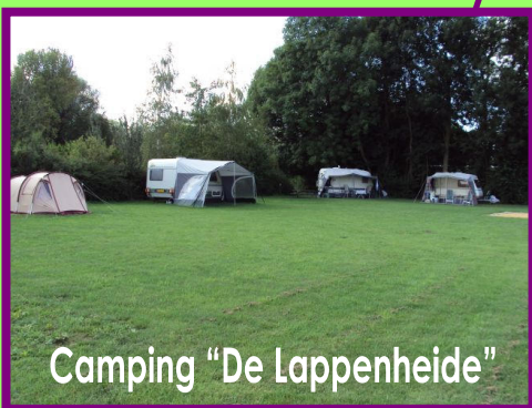
Camping "De Lappenheide"

GSM Gertjan: 06 51122766 GSM Coby: 06 10618511